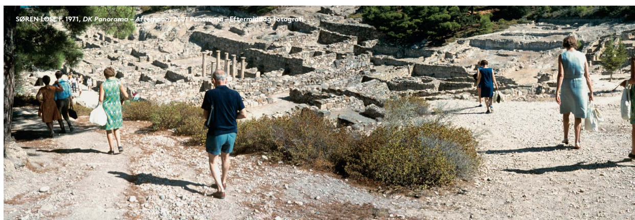
Computermanipulerede og opklæbet med plexiglas/ Photograph. Computermanipulated and glued with Plexiglas Købt/Acquired 2003

Udført af Asger Jorn i samarbejde med fotograf Arne Abrahamsen/Made by Asger Jorn in collaboration with Arne Abrahamsen Gave/gift Arne Abrahamsen, 2002