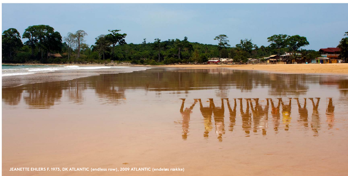
JEANNETTE EHLERS F. 1973, DK ATLANTIC (endless row), 2009 ATLANTIC (endeløs række)

Pigmenteret blæk på Hahnemühle, monteret på diamantglas / Pigmented ink on Hahnemühle, mounted on diamond glass Købt / Acquired 2021