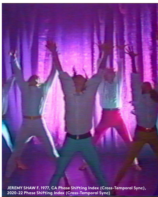
JEREMY SHAW F. 1977, CA Phase Shifting Index (Cross-Temporal Sync), 2020-22 Phase Shifting Index (Cross-Temporal Sync)

Pigmenteret blæk på Hahnemühle, monteret på diamantglas / Pigmented ink on Hahnemühle, mounted on diamond glass Købt / Acquired 2021