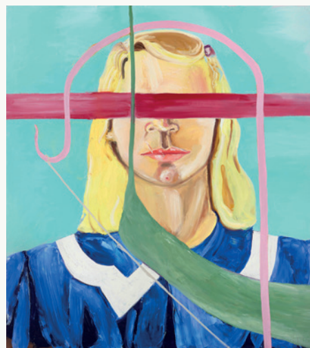
Julian Schnabel Big Girl Painting, 2013

Efter sigende var det Barcelonas mange fine mosaikbænke, som tilbage i 1978 inspirerede Schnabel til at lave plate-paintings.