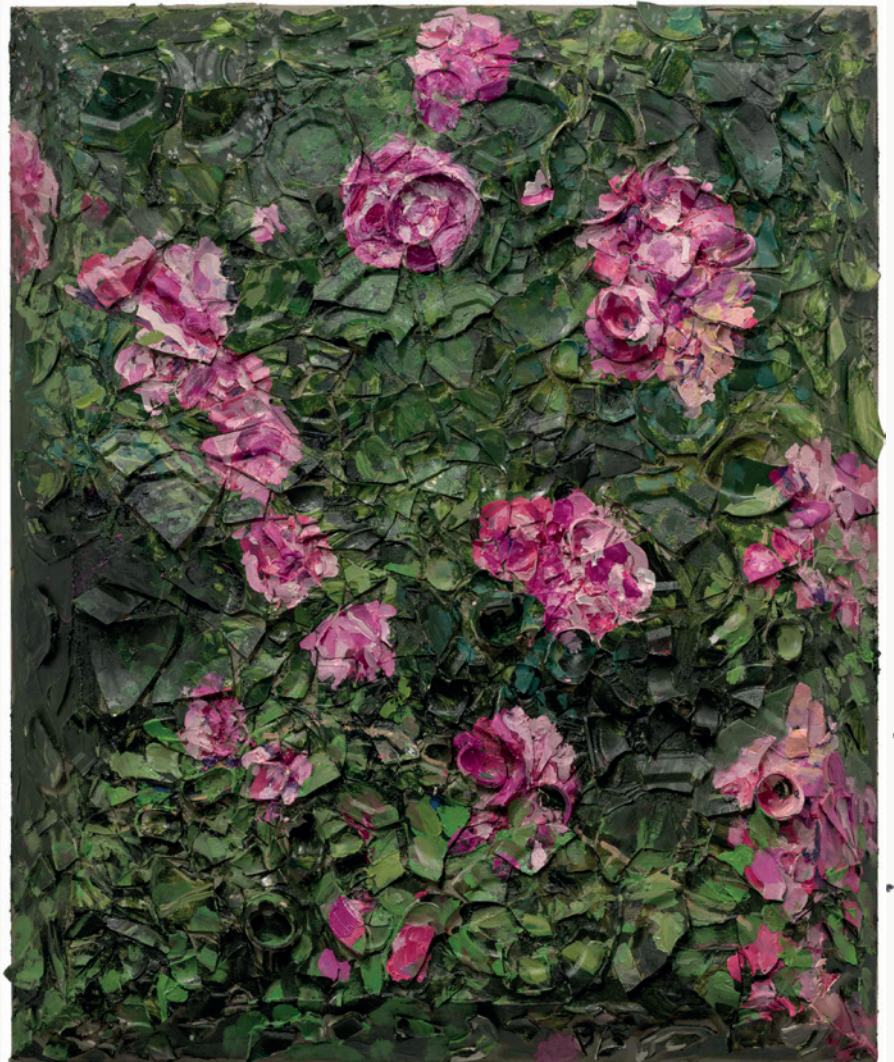
Julian Schnabel Rose Painting (Near Van Gogh's Grave) IX, 2016

N.B. Hvis du vil vide mere om Sætningsmetoden eller lignende indgangsvinkler til arbejdet med samtidskunst i undervisningssammenhænge, kan vi anbefale materialet Nøddknækkere til samtidskunst , udgivet af Skoletjensten og Museet for Samtidskunst.