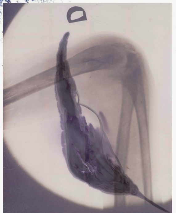
Julian Schnabel Untitled (X-ray), 2011