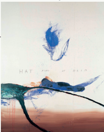
Julian Schnabel Hat Full of Rain , 1996

Julian Schnabel er ikke alene en anerkendt maler, men også er en succesfuld filminstruktør. Han har f.eks. instrueret filmene Basquiat samt Dykkerklokken og Sommerfuglen – og for sidstnævnte blev han endda nomineret til en Oscar for bedste instruktør.